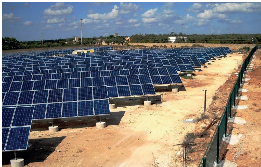
I PANNELLI SOLARI DI ALESSANO PROTETTI DAL SENSORE NARIA SECURITY

Nel 2010 Luceat entrò a far parte del mercato della protezione perimetrale, e nacque così il sistema LiteFence che ha determinato, a partire dal 2011 in poi, un trampolino di lancio effettivo nel mercato di settore.