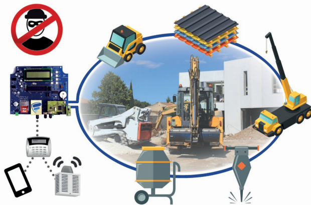
ANTIFURTO DA CANTIERE